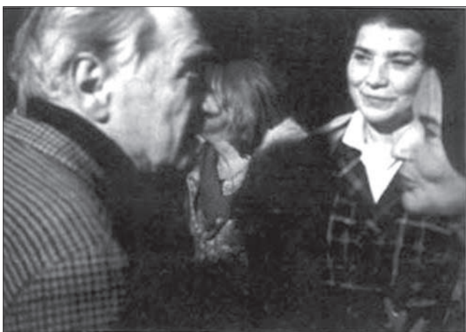
Emil Cioran și Aurora Cornu