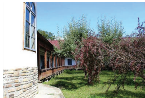
Imagine de la Bolnița Mănăstirii Neamț

Bolnița Mănăstirii Neamț a fost înființată în secolul al XVIII-lea – 1735, conform cărții Din trecutul istoric al spitalului din Tg. Neamț și al ospiciului de alienați din Mănăstirea Neamț în care se arată că Bolnița avea mai multe chilii unde „erau primiți și îngrijiți părinții oboșiți, învechiți și bolnavi (...) chinuți de diferite duhuri și care nu aveau unde să-și plece capol, și-i îngrijea într-un spital aparte. În acea vreme, călugării aveau liberă trecere peste hotare și mergeau mai frecvent la Muntele Athos, dar și în alte locuri, de unde se întorceau cu cunoștințe din diferite domenii. Unii aduceau la înapoiere leacuri făcute din plante sub formă de fierturi și unsoari, care, alături de rugăciuni, slujbe și arderea «esențelor mirositoare» (relicvă a concepției hipocratice, care considera că bolile sunt date de amiasmele din aer) constituiau baza medicinei mănăstirești”. Într-un incendiu din 1841 bolnița a ars, împreună cu o bună parte din mănăstire, dar doi ani mai târziu se hotărâște construirea unui nou local pentru îngrijirea bolnavilor, de data aceasta cu obligația de a avea și un medic și un spițer de profesie. În acest scop este cumpărată (în 1845) spițeria lui Grigore Pădure din Târgu Neamț iar în 1848 se termină și construcția noii clădiri, care există până în zilele noastre.